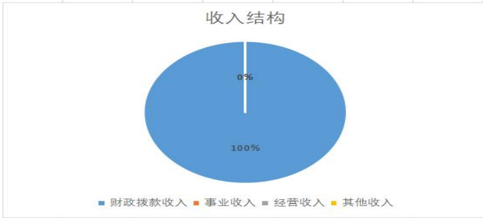
图 1. 收入决算图